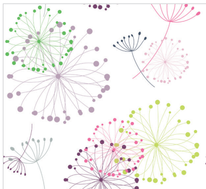
d 470 05