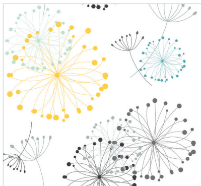
d 470 01