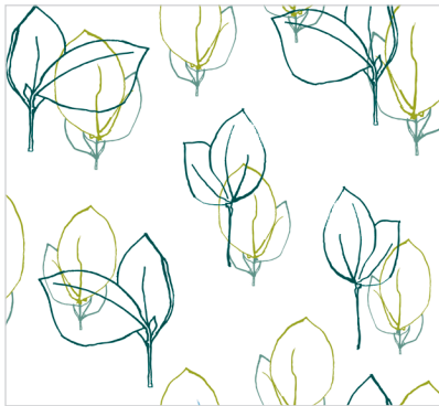
d 466 08