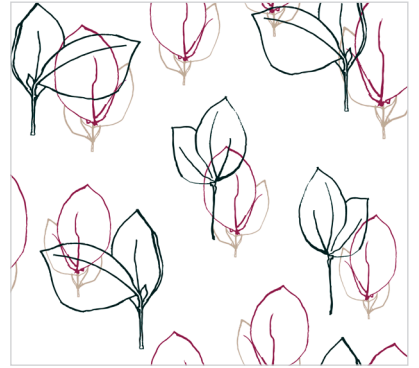
d 466 04