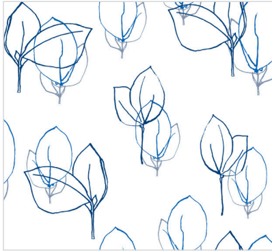
d 466 06