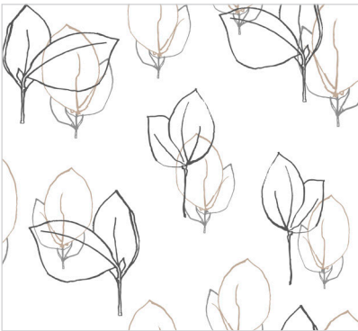
d 466 20