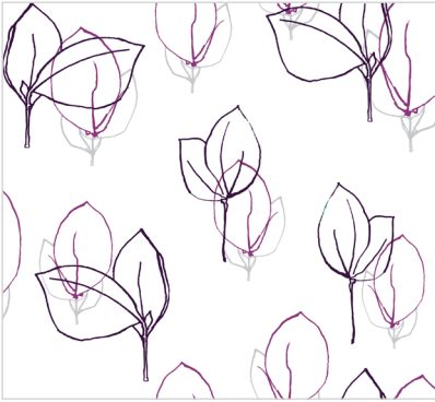
d 466 05