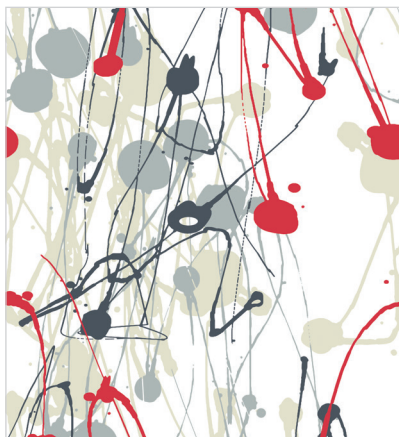
d 475 04