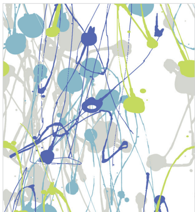
d 475 06