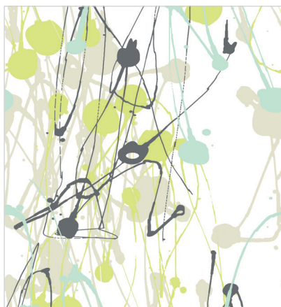
d 475 08