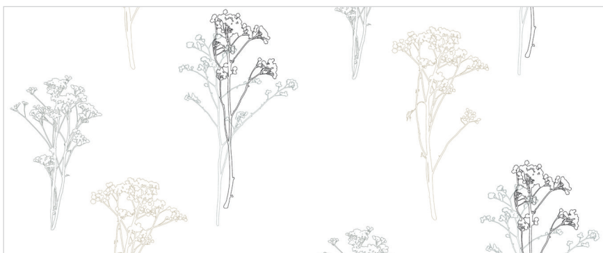
d 477 20