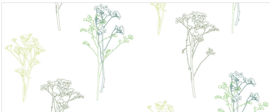
d 477 08