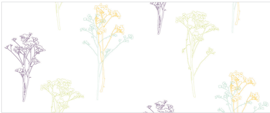
d 477 05